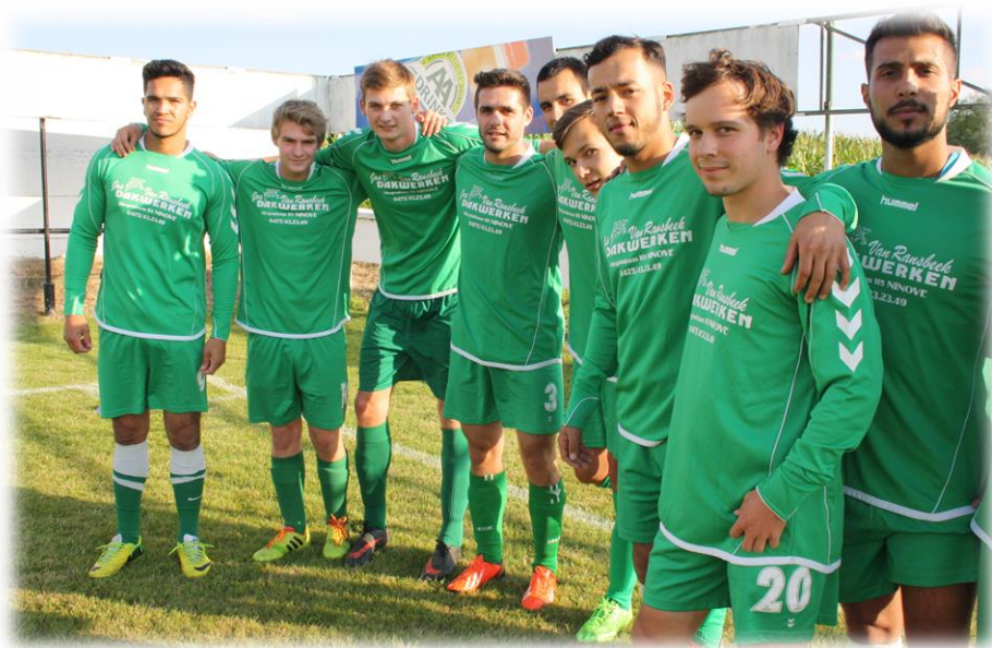
Spelers van de B-ploeg hebben vol frisse moed de trainingen hervat

Terwijl hij deze filosofische overwegingen uitspreekt, kijkt Petrus door de ramen van de kantine. Op de grasmatten is de training begonnen en tientallen jonge atleten lopen zich de ziel uit hun lijf. De augustuszon schijnt vriendelijk op het keurig geschoren gras, dat mooi harmonieert met de groene truitjes van de spelers. Nu maar hopen dat de toekomst voor de Denderzonen er even stralend mag uitzien. (WE)